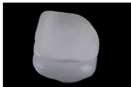
Afb. 20. Na het etsen met hydrofluoride zuur ontstaat soms een wit, kalk-achtig residu.