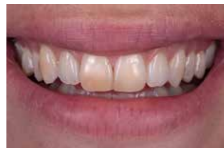
Afb. 1. Patiënte heeft een prachtig gebit, maar stoort zich aan de composiet restauraties op de 11 en 21.