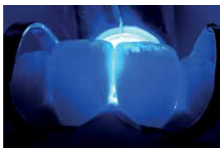
Afb. 24. Polymerisatie vanaf palatinaal voor een langzame start.