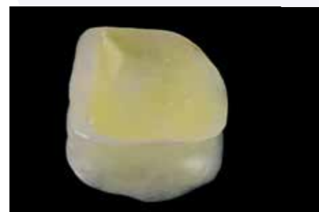
Afb. 19. 60 seconden etsen met 9% hydrofluoride zuur (Porcelain Etch, Ultradent).