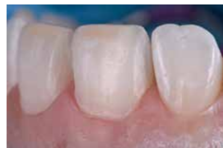
Afb. 9. ... en er is een poging gedaan om interne hoeken zoveel mogelijk af te ronden.