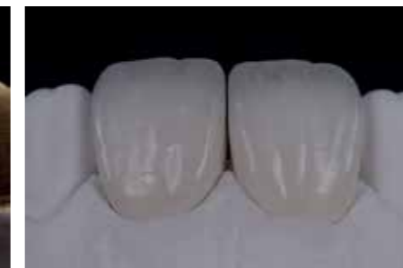
Afb. 13. Prachtige incisale halo en translucentie.