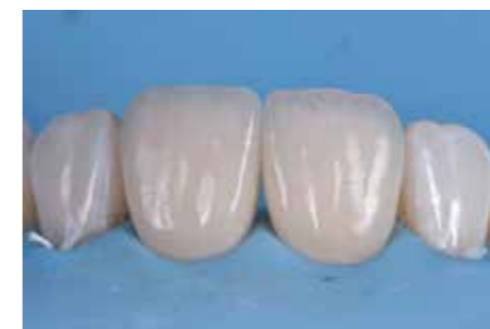
Afb. 26. Nadat alles is gepolijst wordt nog een keer gepolymeriseerd na applicatie van glycerine gel.