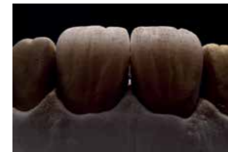
Afb. 12b. Aanbrengen van nog meer micro-effecten.