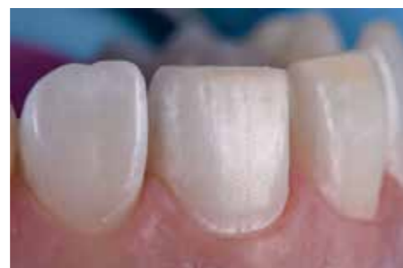
Afb. 8. Preparatie ligt volledig in het glazuur...