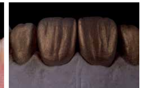
Afb. 12a. Controle van de oppervlakte structuur.