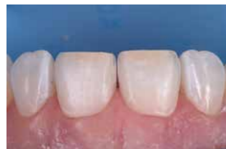
Afb. 7. Minimale preparatie van de centralen