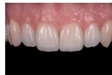
Afb. 29. De facings vormen één geheel met de rest van het gebit.