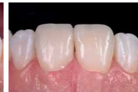
Afb. 11. Het cervicale deel van de tijdelijke voorzieningen is uit de hand opgebouwd met een flowable.