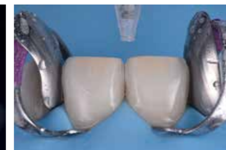
Afb. 16. Zandstralen met de AquaCare en contact-matrices als bescherming voor de lateralen.