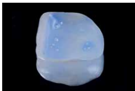
Afb. 21. Door nog een keer te etsen met 35% fosforzuur (Ultra-Etch, Ultradent) en een bezoek aan het trilbadje wordt deze verwijderd.