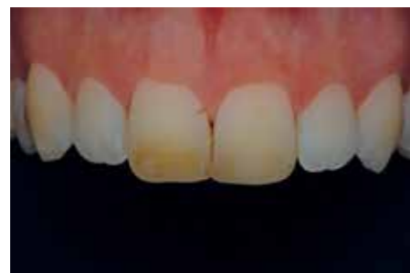
Afb. 5. Een dubbel gepolariseerde opname geeft nog duidelijker het verschil in kleur weer.