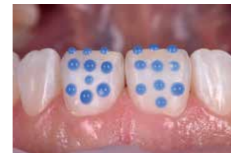
Afb. 10. Tijdelijke voorzieningen worden vastgezet met een spot-etch techniek.

Voorafgaand aan de preparaties worden eerst een aantal kleurenfoto's gemaakt, waaronder een dubbel gepolariseerde opname met grijskaart (zie afbeelding 6). Deze foto wordt gebruikt voor een digitale kleur-bepaling en pasfase (eLab) en is natuurlijk essentieel, omdat een bezoek aan Turijn niet echt mogelijk is.