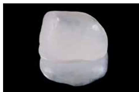
Afb. 23. Na applicatie van silaan (Monobond Plus, Ivoclar Vivadent) en bonding (Optibond FL, Kerr) is alles klaar om te plaatsen.