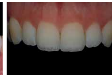
Afb. 28. Dubbel gepolariseerde opname geeft een mooie integratie van de kleur weer.