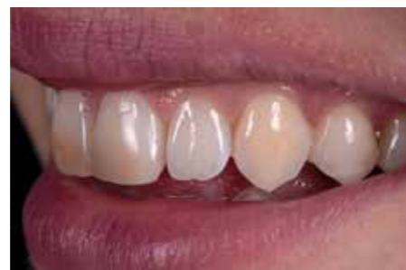
Afb. 2. Een gebrek aan oppervlakte structuur...