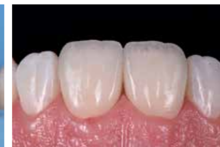
Afb. 27. Direct na verwijdering van de rubberdam.