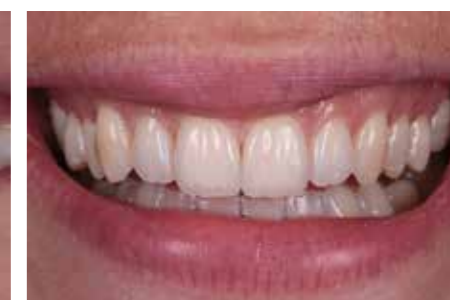
Afb. 31. Een tevreden patiënt, een tevreden tandarts... maar niet zonder zijn tandtechnicus...