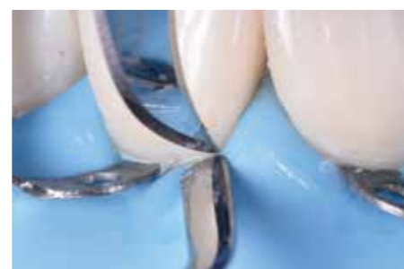
Afb. 25. Overmaat wordt zoveel mogelijk weggesneden met een 12D scalpel.

Zowel op het element als op de facing wordt Op-tibond FL (Kerr) gebruikt en de facings worden geplaatst met een stevige flowable: Majesty ES Low Flow (Kuraray). Polymerisatie wordt gestart vanuit palatinaal om teveel krimpspanning zoveel mogelijk te voorkomen. Overmaat wordt na polymerisatie bij voorkeur verwijderd met een scherp instrument zoals bijvoorbeeld een 12D scalpel. Zo wordt de overmaat niet 'afgebroken', maar 'afgesneden', wat mogelijk verkleuringen op de lange termijn kan voorkomen (zie afbeelding 25). Na polijsten volgt nog een polymerisatie onder glycerine gel en wordt de cofferdam verwijderd.