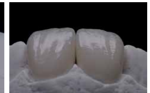
Afb. 14. Levendige oppervlakte structuur.