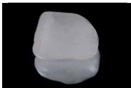
Afb. 18. Veldspaat facing vanuit de binnenkant gezien.