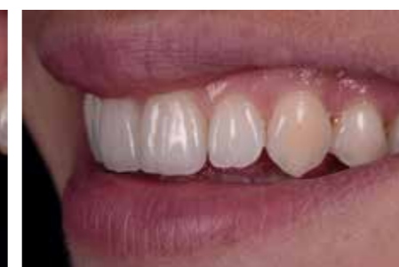
Afb. 30. Een prachtige glimlach 😊