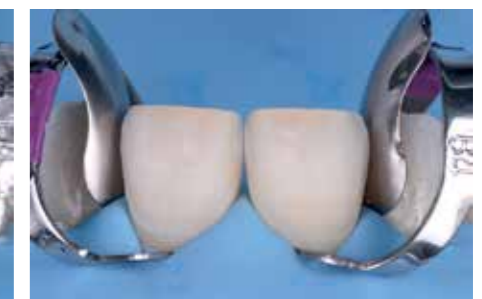
Afb. 17a. Cofferdam wordt op z'n plek gehouden met twee W2 klemmen (Hygienic) op de premolaren (niet zichtbaar), 2 floss-ligatuurjes op de lateralen en twee B4 klemmen (Hygienic) op de centralen.