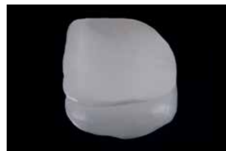
Afb. 22. Een schone en kleefwillige veldspaat facing.