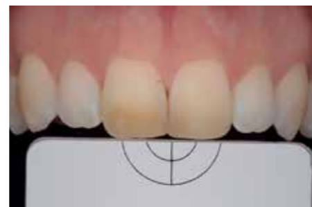
Afb. 6. Dubbel gepolariseerde opname met grijskaart voor een digitale kleur-bepaling.