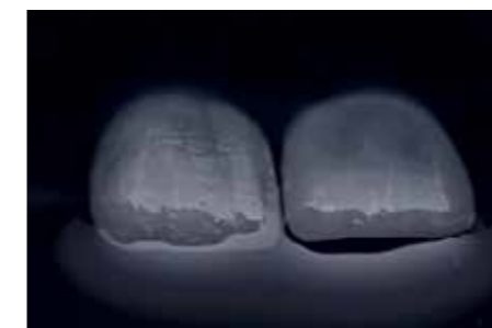
Afb. 15. Tandtechnische kunst.