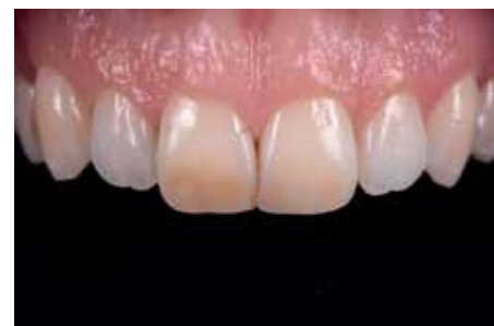
Afb. 4. ... en een dof aspect maken de voortanden niet levensecht.