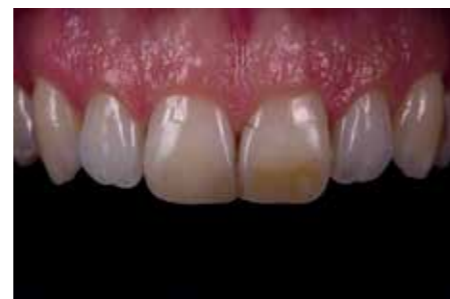
Afb. 3. ...verkleuringen...